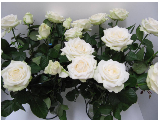
Behandeling: water tijdens transport-, winkel- en consumentenfase