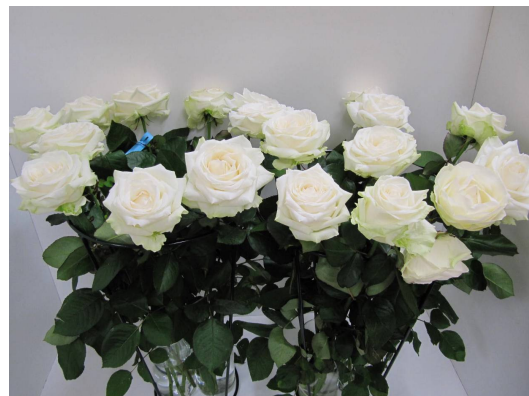
Behandeling: Chrysal Grow 30 als voorbehandelingsmiddel en tijdens transportfase / water tijdens winkel- en consumentenfase