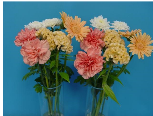
プロ2 2X 200倍液(適正濃度) 9日後

「プロ2 2X」を適正濃度の200倍液、2倍濃度の100倍液で比較したところ、どちらもミックスブーケに対し日持ち効果が高く、害は見られなかった。