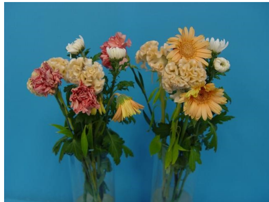
対照区 水 9日後

「プロ2 2X」を適正濃度の200倍液、2倍濃度の100倍液で比較したところ、どちらもミックスブーケに対し日持ち効果が高く、害は見られなかった。