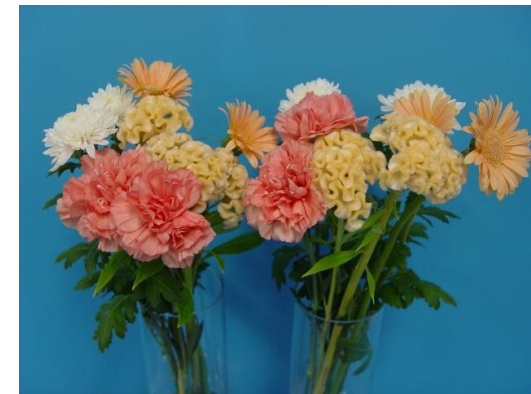
プロ2 2X 100倍液(2倍濃度) 9日後