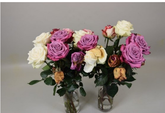
Tratamiento: sin inmersión Fotografía tomada: día 7