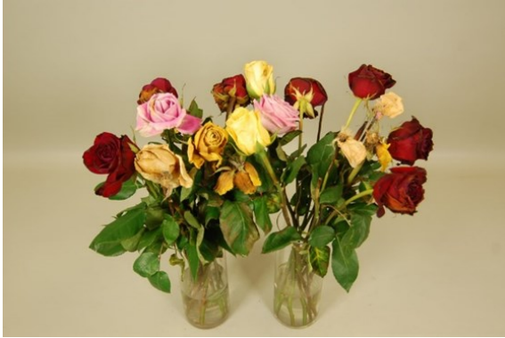
Tratamiento: sin inmersión Fotografía tomada: día 10