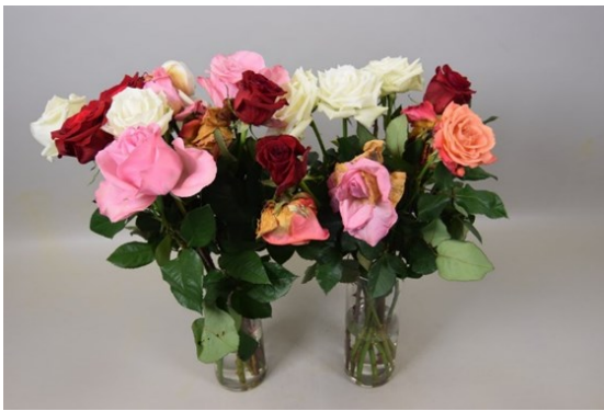
Tratamiento: sin inmersión Fotografía tomada: día 7