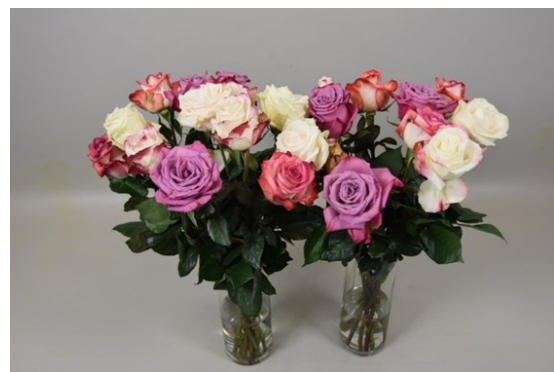
Tratamiento: VIDENTI® con inmersión Fotografía tomada: día 7