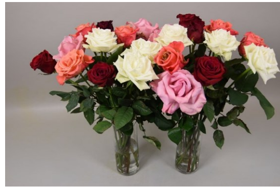
Tratamiento: VIDENTI® con inmersión Fotografía tomada: día 7