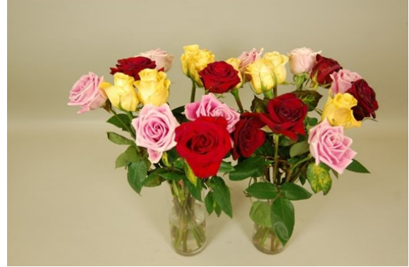
Tratamiento: VIDENTI® con inmersión Fotografía tomada: día 10